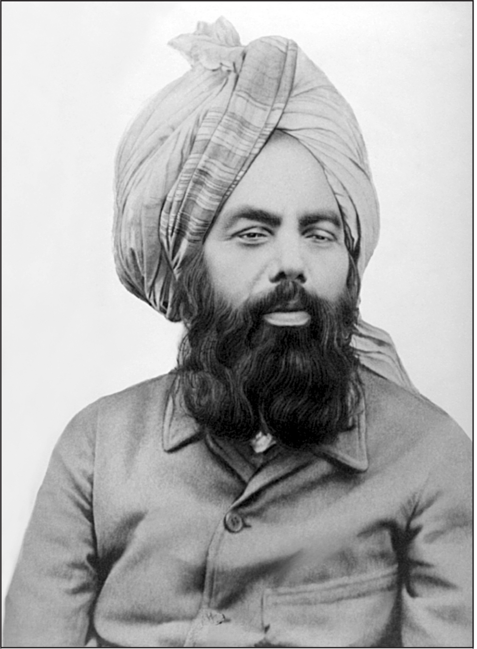
حضرت مرزا غلام احمد دایانی سیح موعود و مهدی موعود علیہ السلام